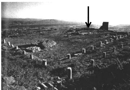
Pergam. Ruinele bibliotecii

m altitudine deasupra orașului actual, avea o mare perspectivă asupra întregii regiuni. Ruinele de azi datează din vremea Atalizilor, puternicii regi ai Pergamului, care au condus cetatea în secolul al III-lea și al II-lea î.d.Hr. Sub regele Eumenes, cetatea cunoaște o puternică înflorire spirituală, devenind un centru intelectual cu renumite școli de gramatică, de medicină, adevărată oază pentru artiști și oameni de știință.