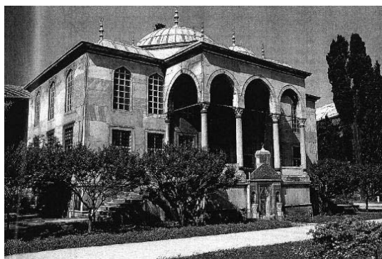
Istanbul. Palatul Topkapı. Biblioteca lui Ahmed al III-lea

De la Efes, facem un salt în timp, de 1500 de ani, și ne întoarcem la Istanbul , fostul Constantinopol, orașul care nu doarme niciodată, cu amețitoare suprapunere de mentalități și cutume, expresia cea mai elocventă a unei civilizații ce și-a aprins propriul foc din scânteile altora.