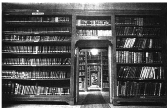
Halki. Biblioteca Școlii de Teologie Ortodoxă

IV-lea (1842-1845 și 1852-1853). În ciuda unor mari dificultăți, complexul monastic, cuprinzând biserica Sfânta Treime și trei paraclise dedicate Maicii Domnului, Sfântului Ilie și Sfântului Gherman, a fost restaurat și ceremonia de inaugurare pentru noua școală a avut loc pe 23 septembrie 1844. Timp de 127 de ani, această instituție a format personalități de mare valoare ale Bisericii noastre ortodoxe. Din rațiuni politice, în urma conflictului dintre turci și greci din Insula Cipru, activitatea departamentului teologic a fost suspendată în august 1971, iar cea a școlii în 1984.